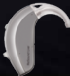
Power BTE – NEW!